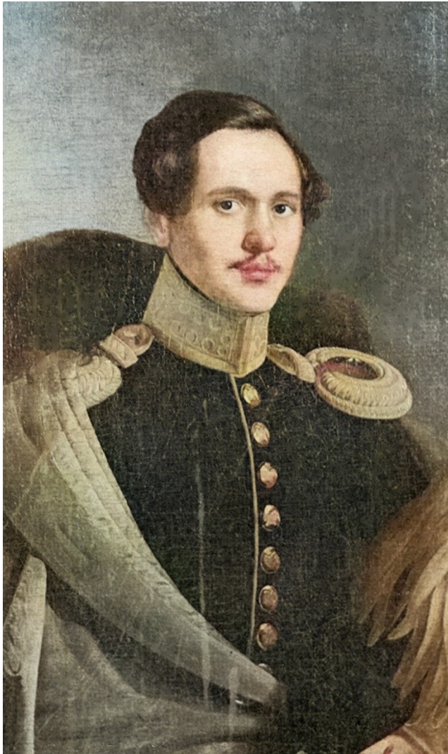
Михаил Лермонтов. С портрета П.З.Захарова-Чеченца.