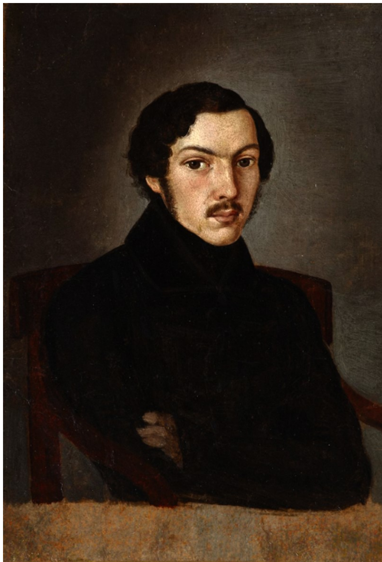
Николай Соломонович Мартынов. 1843. Художник не установлен.