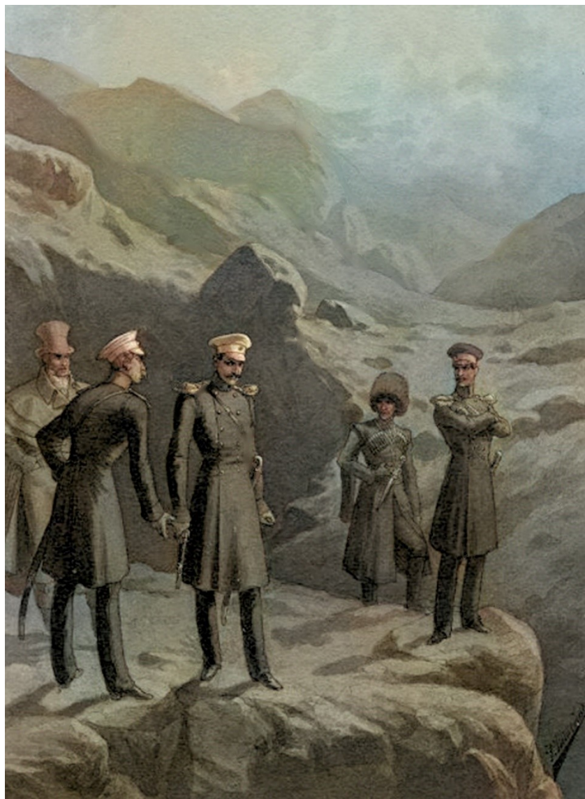
Герой нашего времени. С рисунка Ральфа Штейн.