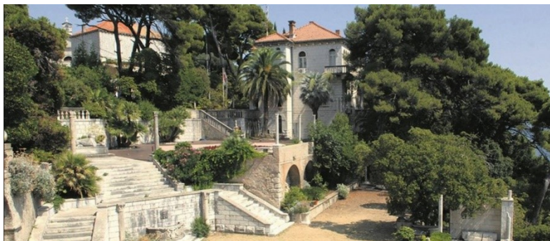
Камен мали до пожара

В этот раз посещая Хорватию, я хотел наладить связи в архивах Дубровника, вновь посетить Villa Flora Miga, в которой в тридцатых годах прошлого века дважды гостил поэт Игорь-Северянин, взглянуть на дом Лидии Ираклиди в Цавтате.