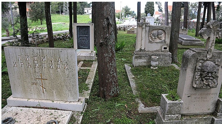
Кенотаф Лидии Ираклиди. Цавтат