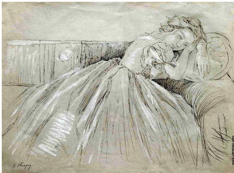
Пётр Нилус. Мечтающая. Иллюстрация к рассказу «Соловьи».1900.